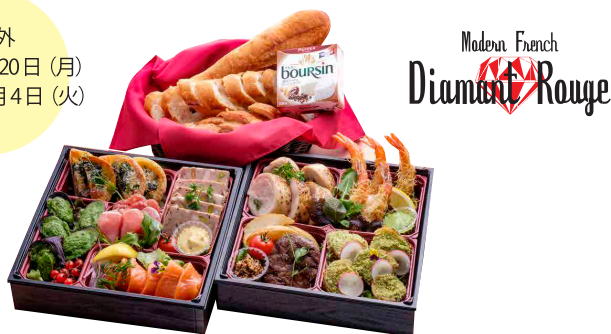
【ディアマンルージュ】麗冠（レカン）