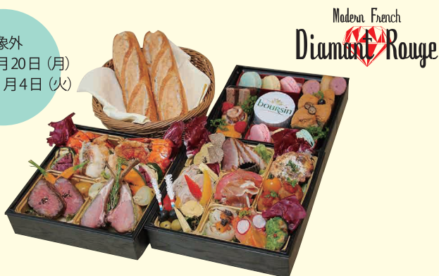
【ディアマンルージュ】プレミアム麗冠（レカン）