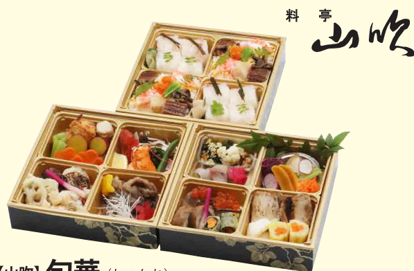
【山吹】旬華（しゅんか）