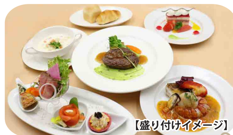
【盛り付けイメージ】