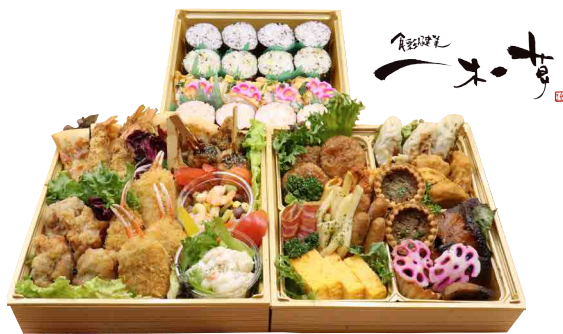
【一木一草】おうち de いちもく